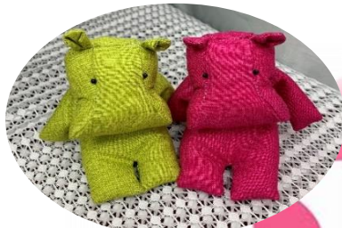
なぜかカバもいます