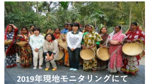
2019年現地モニタリングにて

支援金額はインド支援連絡会（6地域）で総額90万円、そのうちみどりは10万円の予定です。