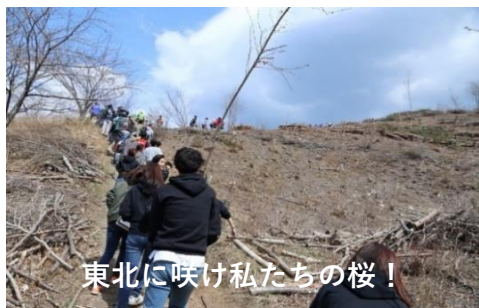
東北に咲け私たちの桜!

桜の苗木はこれからもずっと残されたご家族を見守ると同時に、津波の恐ろしさを伝えていくことでしょ