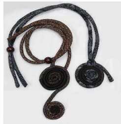
着物地のペンダント