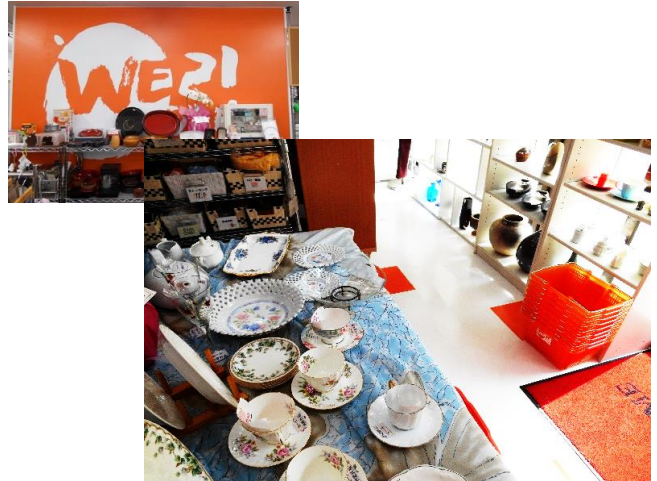
店内を白とイメージカラーのオレンジで統一しました